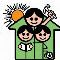
Hogar Zacarias Guerra